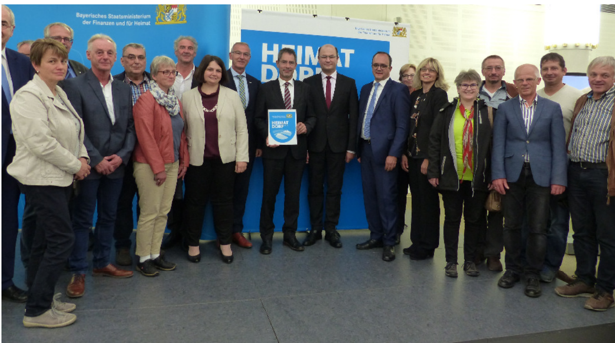
Die Mitglieder der Arbeitsgruppe „Heimatdorf 2019“ mit Minister Füracker und Abgeordneten bei der Preisverleihung im Finanz- und Heimatministerium.

Wir dürfen uns jetzt 10 Jahre mit dem Prädikat " Dittenheim – Heimatdorf 2019 " schmücken!